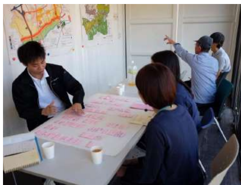
住民の皆さんとの語り合いの様子