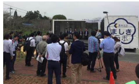
10月19日の開所式の風景

熊本大学は10月19日に秋津川河川公園に「ましきラボ」を開設しました。益城町の復興を住民の皆さんと学生・教員が語り合う場をめざしています。毎週土曜日午後2時から5時の時間帯は、熊本大学の教員と学生が常駐しています。ぜひお気軽にお越しください！