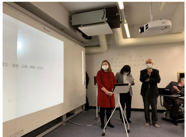
グループワークの発表