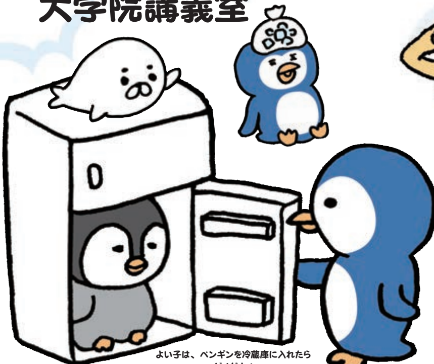
よい子は、ペンギンを冷蔵庫に入れたら ダメだよ!