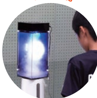
竜巻を人工的に発生させて 観察するよ!