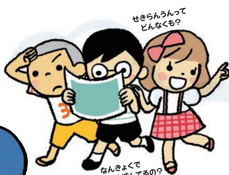
せきらんうんって どんなくも?