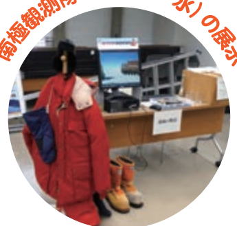
南極観測の紹介と 南極のなぜ?を解説するよ!