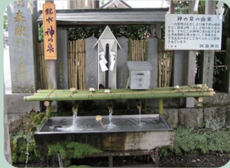
阿蘇神社周辺のフィールドワーク