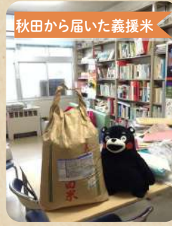
秋田から届いた義援米