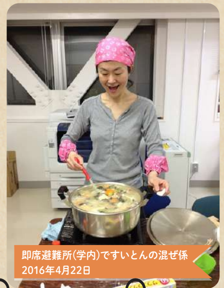
即席避難所(学内)ですいとんの混ぜ係 2016年4月22日