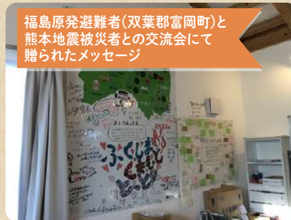
福島原発避難者(双葉郡富岡町)と 熊本地震被災者との交流会にて 贈られたメッセージ