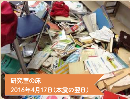
研究室の床 2016年4月17日(本震の翌日)